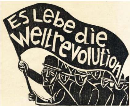
Conrad Felixmüller, Aufruf (Es lebe die Weltrevolution), 1920

Holzchnitt, 14 x 17 cm, Auflagedruck vom Originalstock für die Zeitschrift „Die Aktion“, Titelblatt vom X. Jahrgang, Heft 17/18, 1. Mai 1920 (Detail)