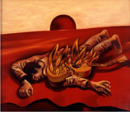
Wolfgang Mattheuer, Requiem für Victor Jara, 1973